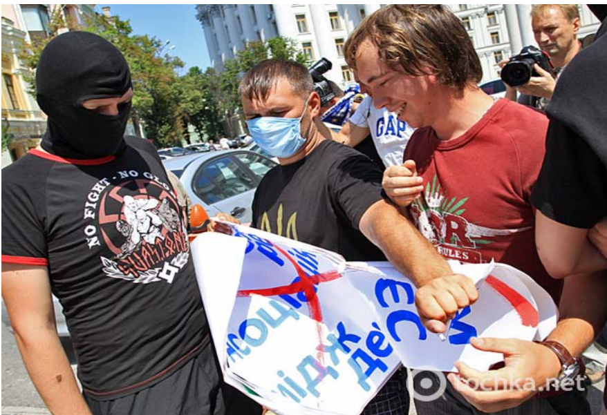
Напад «свободівців» на мирний пікет ЛГБТ біля МЗС.

Другий випадок (кейс 425) – пікетування ЛГБТ-активістами українського МЗС в липні 2012 р. на знак протесту проти законопроекту № 8711 (про заборону «пропаганди гомосексуалізму»), зірване бойовиками з ВО «Свобода». Викликана міліція вишикувалася в шеренгу неподалік і нічого не зробила для забезпечення законного права ЛГБТ на мирне зібрання ( http://news.tochka.net/122837-berkut-polyubovalsya-stychkoy-geev-i-svobodovtsev-foto/ ).