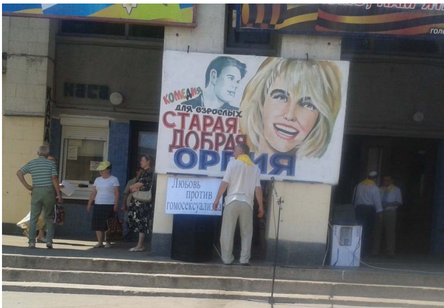
Акція в Херсоні 19.04.2012 р.