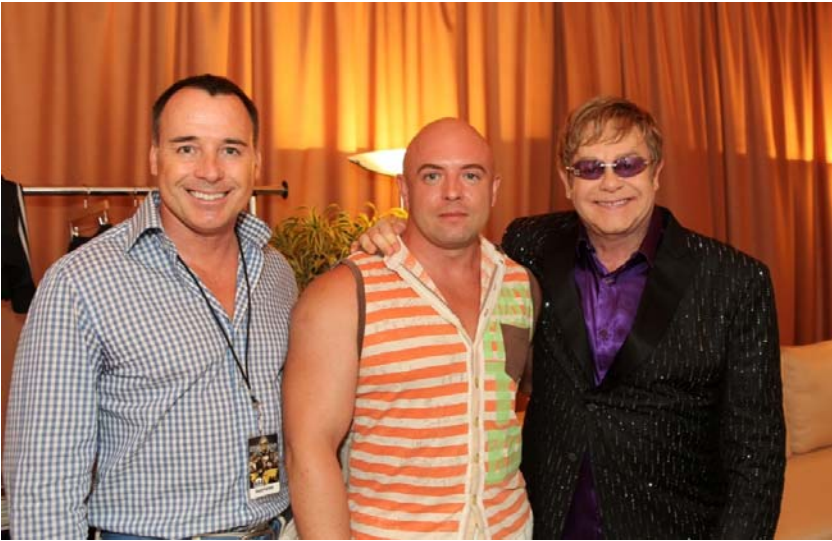
Е. Джон (праворуч) зі Святославом Шереметом (у центрі), одним з організаторів «Київ-Прайду-2012»

( http://www.guardian.co.uk/commentisfree/2012/jul/01/gay-rights-human-rights-elton-ohn?newsfeed=true ).