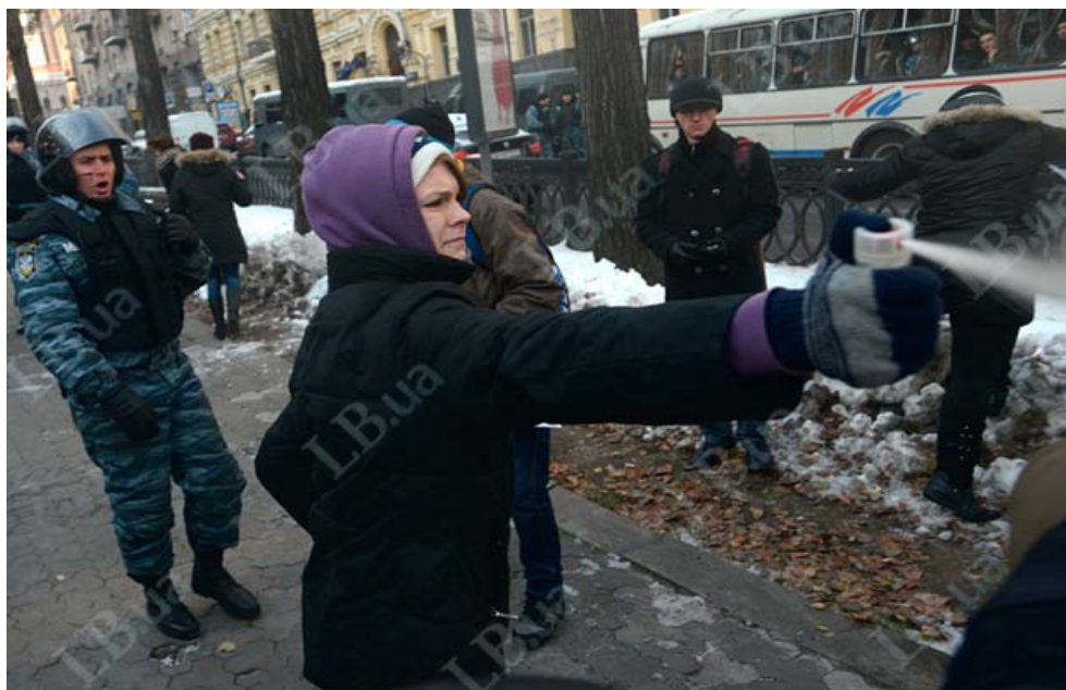
«Свободівці» розпилюють сльозогінний газ проти учасників мирної акції ЛГБТ.